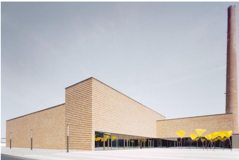
Das Besucherzentrum der Firma Kärcher in Winnenden von Reichel Schlaier Architekten, Stuttgart.