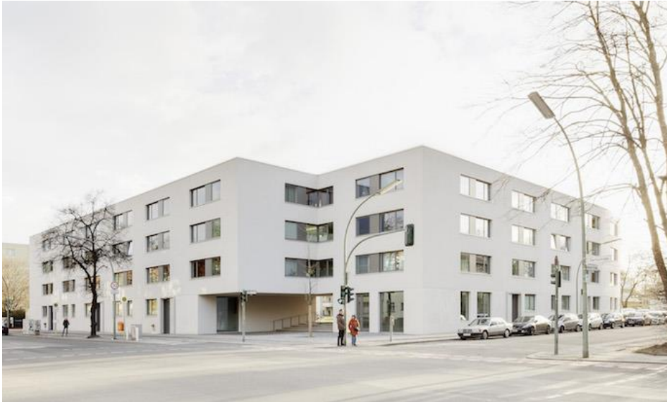
Wohnungsbau am Schillerpark in Berlin von Bruno Fioretti Marquez Architekten, Berlin.