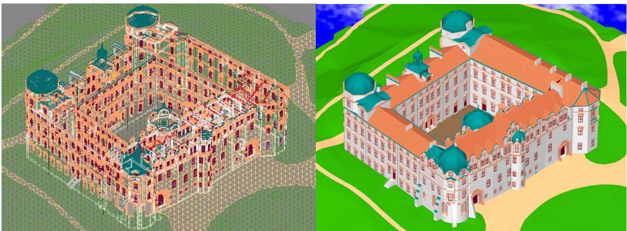
Abb. 5: 3-D-Volumenkörper des Celler Schlosses als Drahtmodell (links) und gerendertes Modell (rechts)

Das Ergebnis der 3D-Konstruktion ist ein Volumenmodell (3D-Volumenkörper, siehe Abb. 5), welches über verschiedene Schnittstellen in AutoCAD in diverse Visualisierungsprogramme wie z.B. 3D Studio VIZ exportiert werden kann. In diesem Projekt wurden allerdings bisher nur die in AutoCAD gegebenen Funktionen für die Herstellung einiger perspektivischer Ansichten benutzt. Dazu wurden u.a. auf die Dachflächen entsprechende Dachziegel-Texturen gelegt. Um die Beleuchtung der Szene realistischer darzustellen, wurden Lichtquellen definiert und Schatten berechnet. Abb. 6 zeigt verschiedene perspektivische Ansichten des Celler Schlosses. Ansprechende Visualisierungen mit Bäumen oder durch Videoanimationen sind zur Zeit in Bearbeitung.