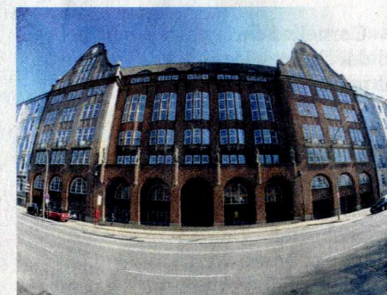
Das Gebäude der Handwerkskammer Hamburg prägt den Holstenwall