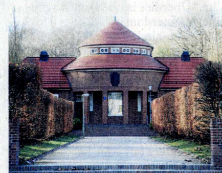
Auch die Trinkhalle im Stadtpark ist ein Schumacher-Bau