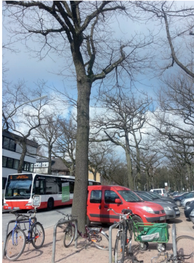
Abb. 1: Nutzungsdruck von Straßenbäumen am Borgweg

Die Mehrzahl der Deutschen lebt schon jetzt in Städten und erwartet eine gute Daseinsvorsorge und hohe Mobilität mit ÖPNV, Fahrrad und PKW. Auch Hamburg wächst und hat sich dabei für die Innenverdichtung entschieden. Damit konkurrieren die Bäume stets um den gleichen Raum mit allen baulichen Veränderungen. Straßen- und Radwegeausbau, Busbeschleunigung, Streckenausbau des ÖPNV, neue Versorgungstrassen für Wasser, Gas, Strom oder Internet und die